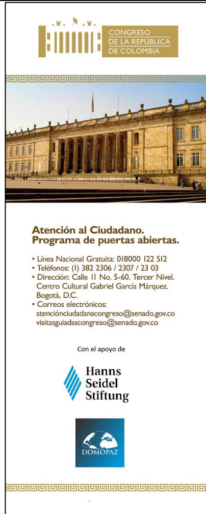
Imagen de referencia de la pancarta rollup: